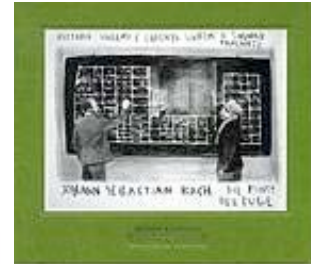
Die Kunst der Fugue WINTER & WINTER