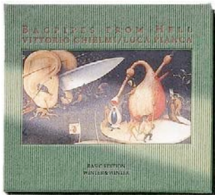
Bagpipe from Hell WINTER & WINTER