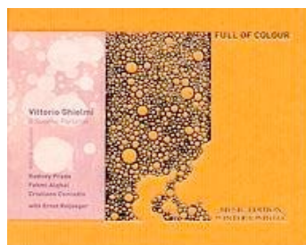
Full of colour WINTER & WINTER