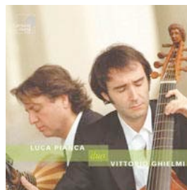
El canto del Cisne HARMONIA MUNDI