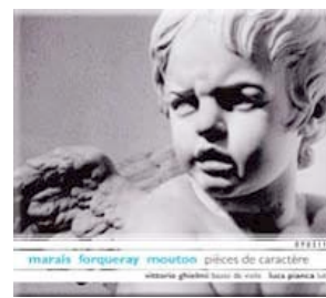
Pièces de Caractère OPUS 111/ NAÏVE 2002