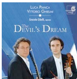
The Devil's Dream HARMONIA MUNDI